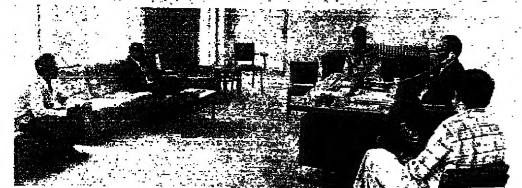
اتصال هاتفي لتأمين المياه